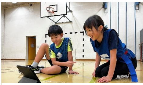
ICT 機器で「できる」に近づく

また、「ともに学ぶ楽しさ」では、どの子ども「友だちと学び合うと楽しい」を感じられるよう、互いの試技を見合ってアドバイスをしたり、チームで作戦を立てたりしています。