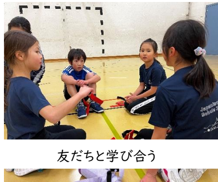
友だちと学び合う