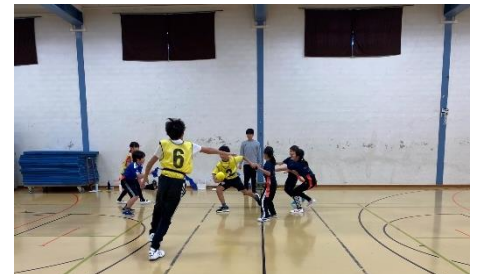
チームの作戦を試す

単元の初めには、子どもたちと学習のゴールを共有しています。そのゴールから逆算して、どのような練習や時間が必要なのかを話題にして、単元の計画を立てていきます。